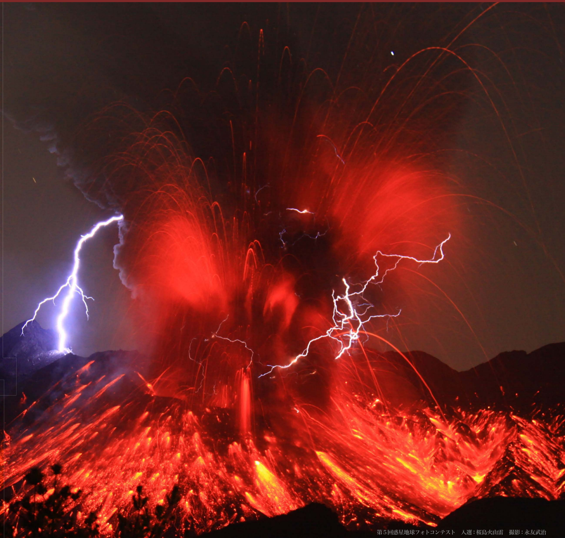
第5回惑星地球フォトコンテスト 入選：桜島火山雷